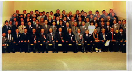
志太榛原稲門会設立総会 平成16年11月23日 於藤枝市青木小学校

いただきました。その後平成16年に志太榛原稲門会が設立され、そちらにも所属することになりました。